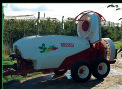
{ Imperator }

Test en lumière noire (pensez à prendre une lampe de poche)