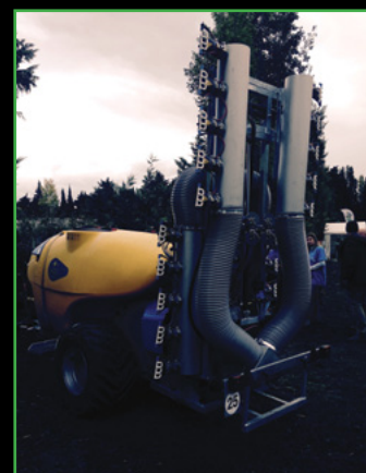
{ KWH }